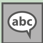
Geen moeilijke termen